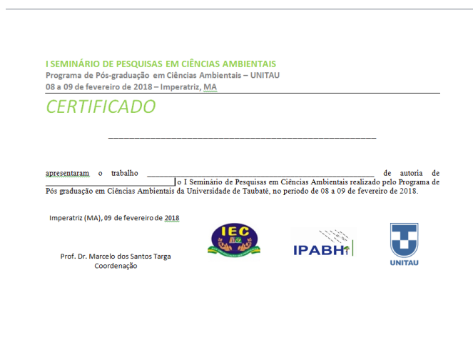
Figura 1 Modelo de Certificado entregue aos participantes que apresentaram trabalho.

Na Figura 1 é demonstrado o modelo de Certificado que foi emitido aos participantes e apresentadores de trabalhos científicos e na Figura 2 o certificado entregue a Palestrantes.